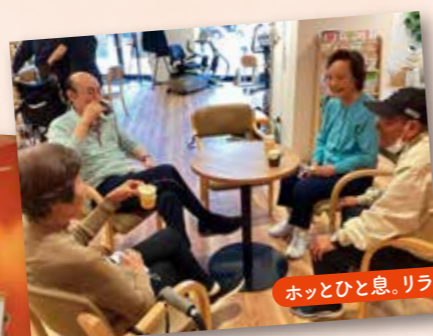
ホッとひと息。リラックス