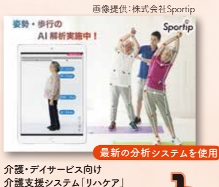
最新の分析システムを使用