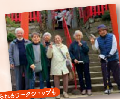
季節を感じられるワークショップも